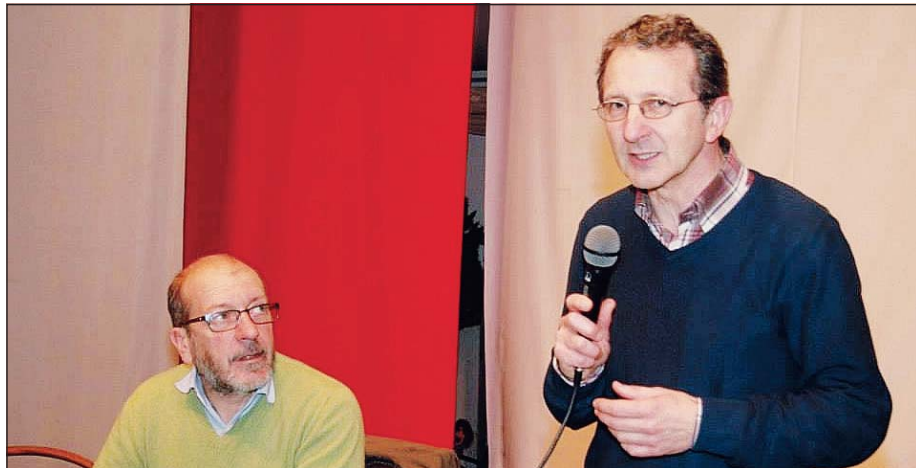
Con il sindaco Dario Vergassola ospite a Bosaro