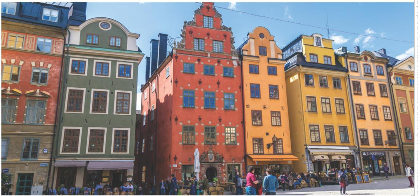
Stortorget, la grande piazza di Gamla Stan, il cuore più antico del centro storico di Stoccolma