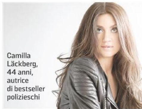
Camilla Läckberg, 44 anni, autrice di bestseller polizieschi

Per diversi anni ho abitato in una grande casa nella parte vecchia di Enskede , un comune residenziale, molto verde, a sudovest di Stoccolma. È una zona dove i turisti in genere non arrivano, un centro sorto all'inizio del Novecento come quartiere operaio e dove ancora oggi si possono ammirare le tipiche case di legno colorate con i tetti a punta e i bei giardini che si affacciano sulle strade tortuose. È un posto che mi piace molto, l'ideale con quattro bambini più o