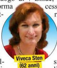
Viveca Sten (62 anni)

A lla vigilia del solstizio d'estate, decine di ragazzini si ritrovano al campo di vela di Lökholmen, isolotto di fronte a Sandhamn, nell'arcipelago di Stoccolma, in Svezia. Quello che doveva essere uno spensierato luogo di vacanza e formazione si trasforma presto nel teatro di un crimine, attorno al quale ruota In nome della verità , ottavo capitolo della serie gialla di Viveca Sten I misteri di Sandhamn . Tutto comincia con la scomparsa di uno dei giovani ospiti del campo. Tra le ipotesi sulla sua sparizione, quella di un incidente è presto accantonata. Si pensa, invece, a un atto di bullismo da parte dei ragazzi più prepotenti, che dall'inizio del corso avevano preso di mira i fragili. Non è esclusa nemmeno la possibilità di un rapimento, magari da parte di un maniaco, che avrebbe potuto spiare indisturbato nell'ombra i giochi degli allievi velisti. In prima linea nelle indagini ci sono i due