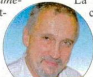
Jussi Adler-Olsen (69 anni)

Tutto comincia quando, su una spiaggia cipriota, le onde restituiscono il corpo senza vita di una donna mediorientale. Nel frattempo, a Barcellona, l'inesorabile contatore della vergogna aggiorna il numero delle vittime a 2.117. Una cifra agghiacciante che comprende, dall'inizio dell'anno, chi è annegato nel tentativo di raggiungere via mare il Vecchio continente. Il punto, però, è che la sconosciuta rinvenuta a Cipro è stata vittima di un omicidio e non delle carrette del mare. Mentre la notizia fa il giro dei media internazionali, un ragazzo di Copenaghen, blindato