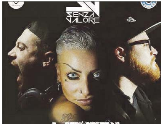
La cover "Liberi" dei Senza Valore