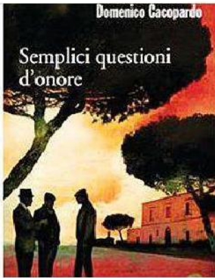
“Semplici questioni d'onore” di Domenico Cacopardo (Marsilio, pagg. 305, Euro 17,00)