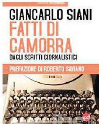
“Fatti di camorra” di Giancarlo Siani (Edizioni Iod, pagg. 208, Euro 12,00)