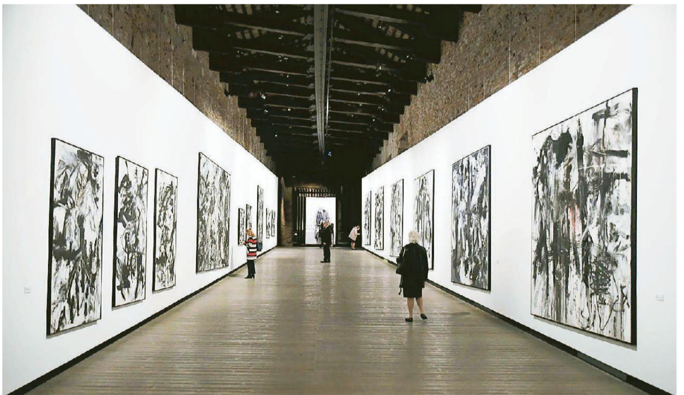
La mostra di Emilio Vedova al Magazzino del Sale delle Zattere, curata da Georg Baselitz

Le opere degli anni Sessanta scelte da Baselitz sono quelle anticipatrici dei Plurimi, in cui Vedova stacca il quadro dalla parete e lo installa nello spazio tridimensionale, smembrando la superficie pittorica in un insieme di elementi frammentati. Quelle degli anni Ottanta precedono invece il periodo dei Dischi, dove la reminiscenza rinascimentale del formato circolare del quadro è indagata e portata ai suoi limiti. Più materiche le opere degli anni Ottanta, dove a volte, come lampi, si insinuano pennellate di colore, come il viola. Ma la stessa energia permane anche in quelle di vent'anni prima, dove le rare inserzioni cromatiche virano invece sul giallo e sul rosso. Vedova e Baselitz - più giovane si diversi anni - erano legati da una profonda e duratura amicizia fin dai primi anni Sessanta nella Berlino divisa dal muro, dove Vedova vis-