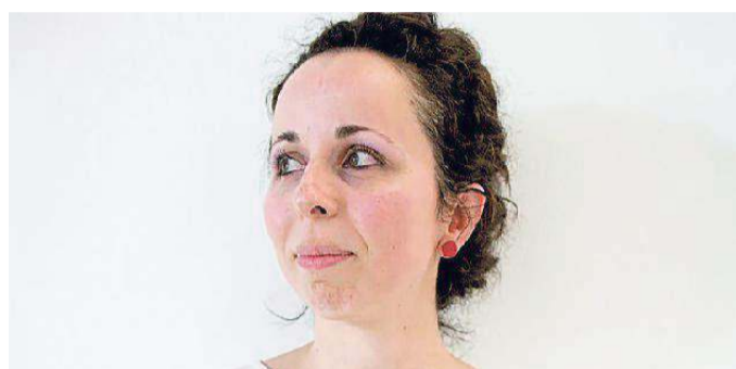
L'artista Marzia Migliora

Una "Fabbrica illuminata", a Ca' Rezzonico, fa emergere la problematica dello sfruttamento, antico e moderno, che mette a repentaglio la vita della natura, dell'uomo, del lavoro. Nel portego de mezzo sono allineati cinque banchi da orafino illuminati da una fila di neon e sui quali, per ciascun ripiano superiore, è collocato un blocco di salgemma. L'opera dell'artista Marzia Migliora con i due elementi che la compongono - il sale, "oro bianco" fonte di commercio nella storia di Venezia, e i banchi da orafino - riporta allo sfruttamento delle risorse naturali e della forza lavoro necessaria per trasformarla in merce e in guadagno. È la mostra "Velme", un progetto site specific nato in collaborazione con la Fondazione Merz, partnership è Lavazza. E velma, luogo di relazione tra acqua e terra, punto di collegamento tra passato e presente, è una porzione di fondale lagunare poco profondo che emerge con le basse maree. Le velme sono a rischio come lo è l'intero ecosistema lagunare veneziano. La causa, dicono gli esperti, è il degrado morfologico, l'erosione dei fondali marini, la scarsa consapevolezza, le continue violazioni perpetrate dall'uomo.