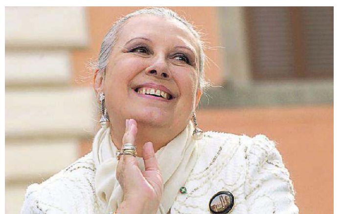
Laura Biagiotti è morta in seguito al malore che l'ha colta mercoledì sera

Anche in Veneto era molto apprezzata: nel 2007 ha ricevuto il Leone Cristallo alla Carriera - Premio Casinò di Venezia durante il Gala Ufficiale a conclusione della Mostra del cinema. Nel 2003 ha donato il nuovo Grande Sipario al Teatro La Fenice di Venezia, dopo che