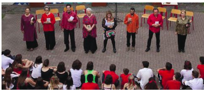
Il Laboratorio teatrale di Diapsi nel recente spettacolo sul senno di Orlando