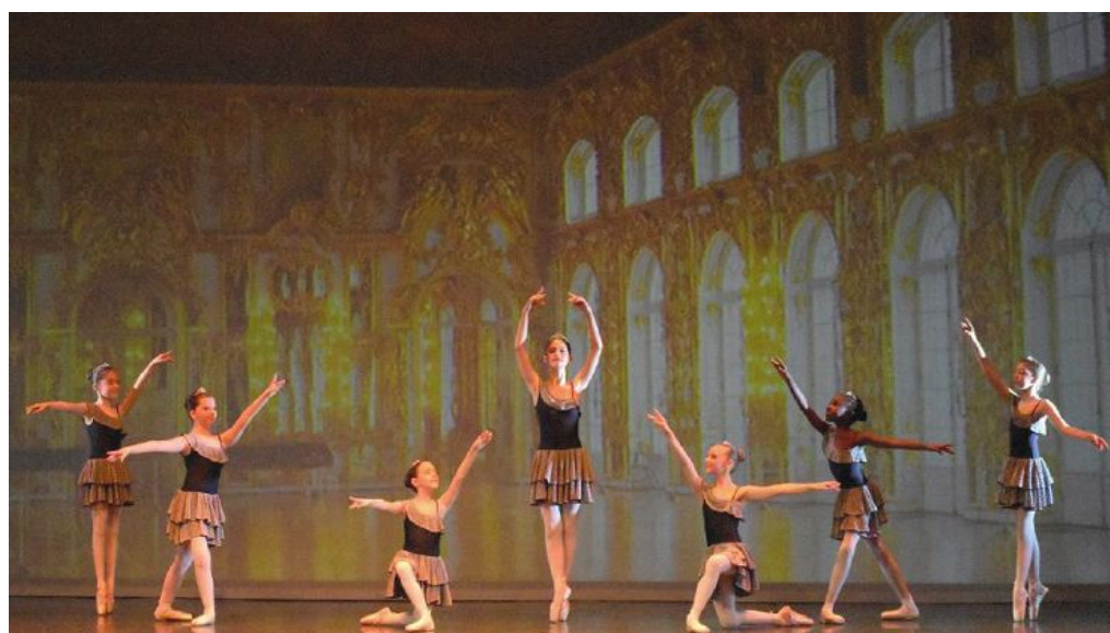
Una suggestiva coreografia portata in scena da un gruppo di allieve della scuola Dance Team

La segreteria è aperta per maggiori informazioni da lunedì a venerdì in Via Sassone 5 dalle 15,30 alle 18,30 oppure 347/0112147.