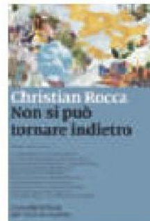
NON SI PUÒ TORNARE INDIETRO Christian Rocca, Marsilio, pag. 304, € 17,50

La memoria, sostiene l'autore in questo acuto saggio, non è una roccia stratificata, e neppure incisa: è fluida, e muta colore e temperatura a seconda delle epoche, è più simile a una colata lavica che non si sa bene in quale forma e dove si rapprenderà. Le ricostruzioni storiche, l'uso che della Storia si fa nei talk show, sulle pagine dei giornali, nei tribunali, divengono dunque un'arma nelle mani di chi le impugna. Piuttosto che essere il luogo da cui si parte per costruire l'immagine del futuro, si tende a usare una ricostruzione del passato come base per avvalorare le scelte presenti.