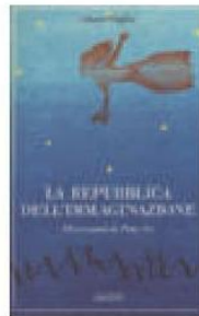
LA REPUBBLICA DELL'IMMAGINAZIONE Azar Nafisi, Adelphi, pag. 288, € 19

Un romanzo che racconta cose "viste, fatte, e viste fare". L'autore dice che quello che scrive è perfettamente verosimile, e siccome frequenta i Palazzi del potere dalla fine degli Anni 70 (era deputato radicale, poi europarlamentare) c'è da credergli. Da chi è composta la casta di cui parla? Giornalisti, cardinali, leader di fantomatici partiti, procuratori della Repubblica. Il luogo è quasi sempre Roma, a volte la Basilicata del petrolio. Un gioco "delle tre carte" che porta in copertina uno strillo di Romano Prodi. Interessante, feroce e di spessore, ma l'intreccio a tratti è faticoso da seguire.