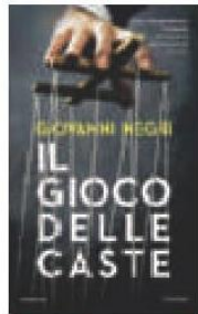
IL GIOCO DELLE CASTE Giovanni Negri, Piemme, pag. 413, € 19,50

C'È LA SCRITTRICE IRANIANA CHE FA DEI ROMANZI UN BALUARDO, IL POLITICO CHE NE SCRIVE UNO