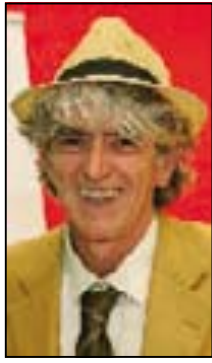
RIVELAZIONE Gesuino Némus (Matteo Locci)

TREVISO - Questa sera alle 20.45 nella sala dei caratteri della Tipoteca di Cornuda incontro con lo scrittore Gesuino Némus (pseudonimo di Matteo Locci), vincitore dell'Opera Prima Premio Campiello 2016. Tra torchi, carta e inchiostri, l'autore racconterà il suo romanzo "La teologia del cinghiale", rivelazione dell'anno, dialogando e improvvisando con Alessandro Comin, responsabile della sezione Cultura e Spettacoli de Il Gazzettino. Il romanzo racconta una storia fitta di misteri e sfortunati eventi avvenuti nel 1969 durante lo sbarco sulla luna, a Telévrás, un disperso paesino dell'entroterra sardo.