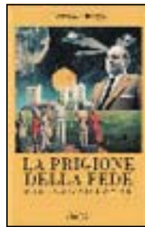
La prigione della fede Scientology a Hollywood Lawrence Wright Ed. Adelphi 28 euro