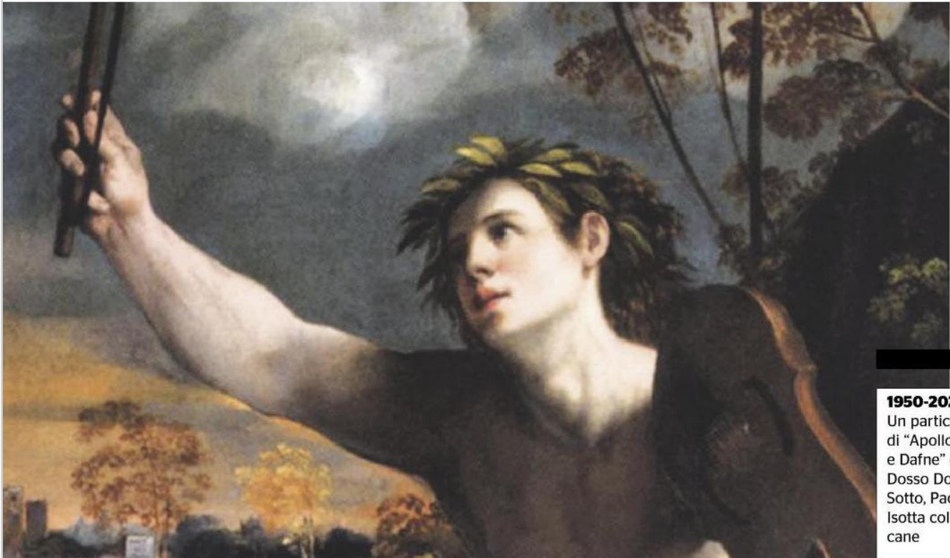
1950-2021 Un particolare di "Apollo e Dafne" di Dosso Dossi. Sotto, Paolo Isotta col suo cane