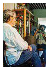
Tobia Scarpa per il festival

ter grafica. Il premio per il miglior film sull'arte è stato attribuito a "Giovanni Segantini - Magia della luce" dello svizzero Christian Labyrinth che ripercorre la vicenda umana di un artista unico per come propone con le sue vedute natura e paesaggio alpino. Nel 2017 è in programma per i tipi di Marsilio l'uscita di un volume dedicato all'artista