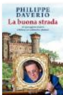
La buona strada Philippe Daverio Rizzoli, 2015 pp. 179, € 11,50

Tre nuovi libri aiutano a conoscere meglio l'Italia e a maturare una consapevolezza di Paese ricco di cultura e di bellezze naturali che potrebbero essere tutelate e valorizzate in modo più fruttuoso. Orizzonte in Italia è una ricostruzione in studio di "una linea che traccia una distanza nel paesaggio italiano", per usare le parole dell'artista-fotografo Antonio Rovaldi. "Un pentagramma cromatico di mari e di cieli" raramente interrotto da presenze umane, oggetti, scritte o appunti visivi (elenchi e grafiche). Una sezione separata, con carte diverse, accoglie i testi di Luca Bertolo, Francesco Zanot, Leonardo Passarelli, Pier Luigi Tazzi e Lorenzo Giusti, che ha curato la mostra al MAN di Nuoro che dopo la Monitor di Roma esponeva una selezione dei lavori che compongono la pubblicazione. Con Resort Italia , il giornalista del Corriere della Sera Lorenzo Salvia cerca degli esempi virtuosi e ipotizza il rilancio della Penisola attraverso la costruzione di una "fabbrica culturale" a base di turismo. Focus su Milano e la Lombardia per La buona strada del critico d'arte Philippe Daverio, un itinerario alla scoperta dei tesori della città di Expo 2015 e i suoi dintorni. (MS)