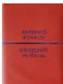
Orizzonte in Italia Antonio Rovaldi Humboldt Books co-edizione MAN di Nuoro, 2015 Italian and english text pp. 324, € 30