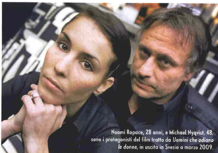
Noomi Rapace, 28 anni, e Michael Nyqvist, 48, sono i protagonisti del film tratto da Uomini che odiano le donne , in uscita in Svezia a marzo 2009.