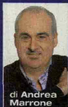
di Andrea Marrone

In libreria Intrighi, banchetti e avvelenamenti nel romanzo di Martigli