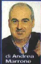
di Andrea Marrone

In libreria I cinquanta nomi del bianco racconta l'infiltrazione della camorra al Nord