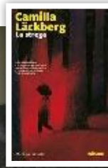
Camilla Läckberg (42 anni), autrice di La strega (Marsilio, pagg. 683, € 19,90; e-book € 11,99).