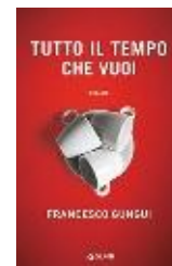
Tutto il tempo che vuoi , di Francesco Gungui (Giunti, pagg. 288, € 14,90; e-book € 8,99).

“Ciascuno è artefice del proprio destino”: un tempo era vero, oggi un po' meno. Lo dimostra Franz, protagonista di Tutto il tempo che vuoi di Francesco Gungui. A 36 anni fa l'editor in una casa editrice e vive con la fidanzata Lucia in un bilocale. Ma di punto in bianco perde il lavoro e la compagna, e gli toccherà ricominciare da zero, partendo dalla passione per la cucina. Tra spunti autobiografici e fiction, un romanzo tenero e ironico su una generazione di precari, costretta a inventarsi il futuro giorno per giorno. (E. Molisani)