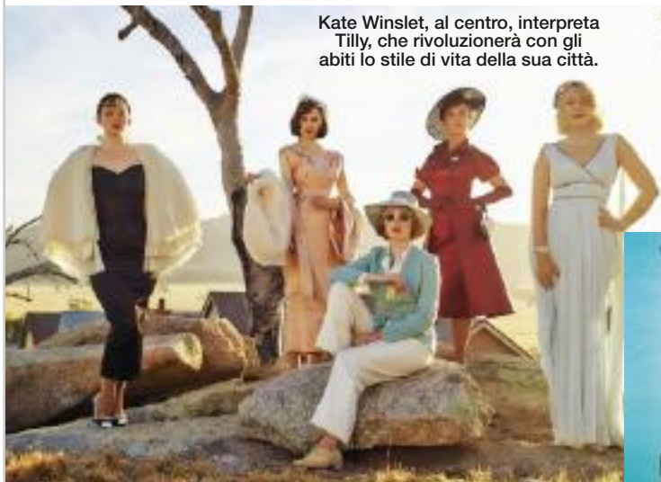
Kate Winslet, al centro, interpreta Tilly, che rivoluzionerà con gli abiti lo stile di vita della sua città.