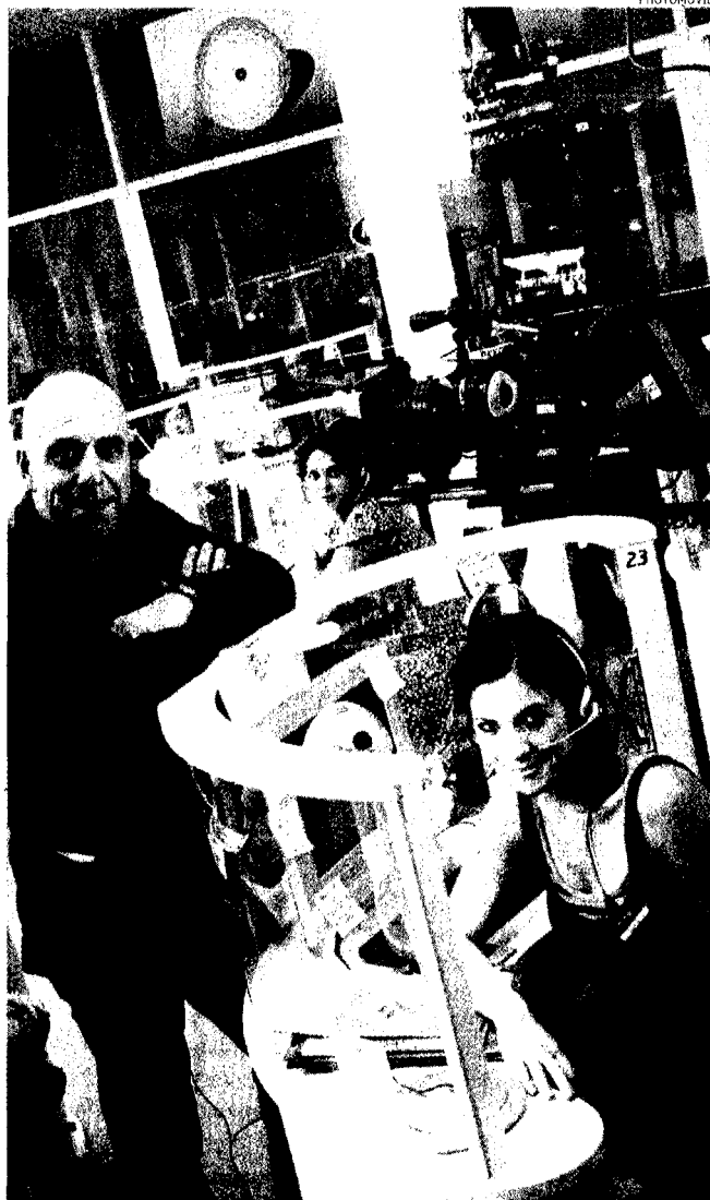
Un'immagine dal set del film di Paolo Virzì (a sinistra), «Tutta la vita davanti», storie di lavoro in un call center, che uscirà in autunno