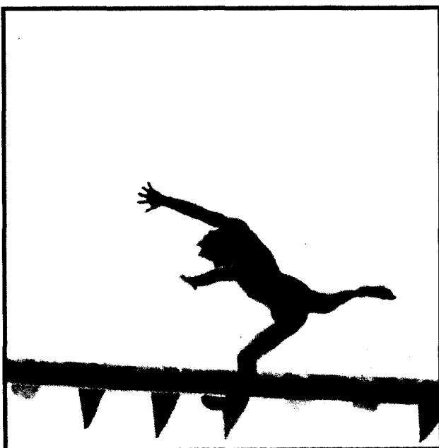
Gela, la Festa della patrona Maria SS dell'Alemanna "Il Paliantino a mare"

Ritaglio stampa ad uso esclusivo del destinatario, non riproducibile.