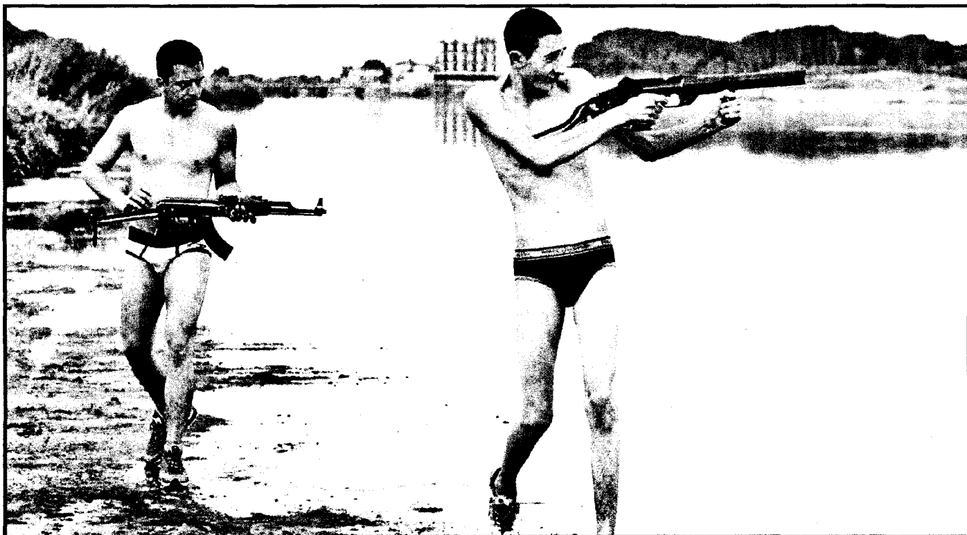
Una scena del film "Gomorra" tratto dal libro di Roberto Saviano