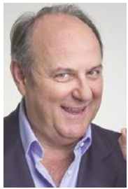
GERRY SCOTTI presenterà la serata finale del premio

ALASSIO (som) In ambito culturale è uno dei momenti più attesi dell'estate. E' il premio Alassio 100 Libri-Un autore per l'Europa di Alassio. L'edizione 2017 si svolgerà venerdì 1 e sabato 2 settembre in piazza Partigiani (in caso di maltempo alla Chiesa Anglicana). Nella prima serata verrà consegnato il premio alla casa editrice (quest'anno è la Minimum Fax), nella seconda, presentata da Gerry Scotti , al libro dell'anno e quindi all'autore o all'autrice.