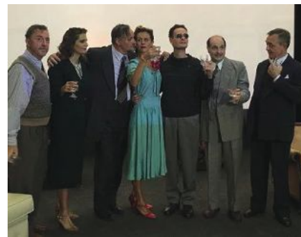
IL CAST de «La cena delle belve»