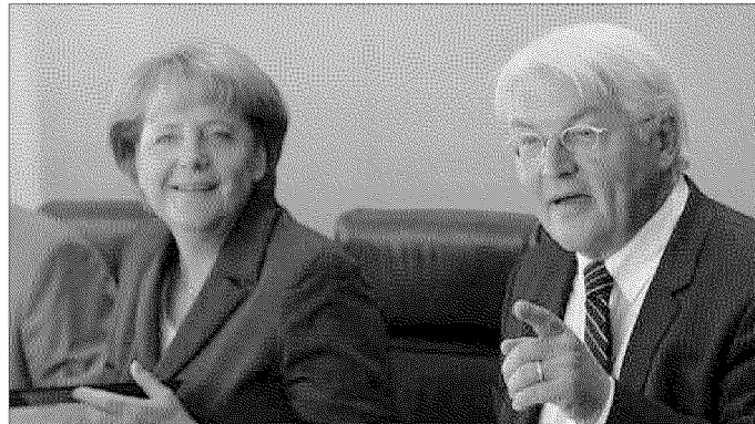
► Angela Merkel tra i potenti del mondo; trentaseienne, agli esordi, con un protettivo Helmut Kohl; sorridente, nel 1999, ai tempi della lettera contro Kohl; infine, con l'attuale partner della Grosse Koalition e candidato rivale alla cancelleria, Frank Walter Steinmeier