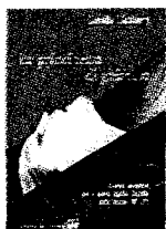
IL LIBRO "La principessa di ghiaccio" di Camilla Läckberg (in alto, sullo sfondo Fjällbacka)

Nata nel 1966 a Uppsala, prima di diventare una scrittrice di noir era un avvocato, come l'eroina dei suoi romanzi Rebecka Martinsson