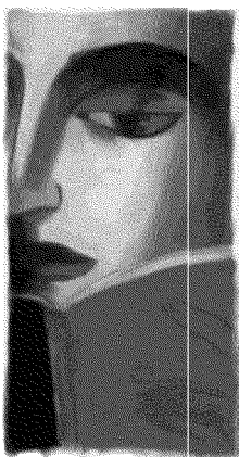
IL GIALLO A fianco un disegno da "Illustrators 41". In alto, Stieg Larsson. Sotto, la copertina di "La ragazza che giocava con il fuoco", edito da Marsilio