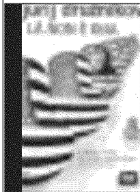
LÀ NON È QUA di Jurij Druznikov Traduzione di F. Orlandi Pagg. 217, euro 16,50