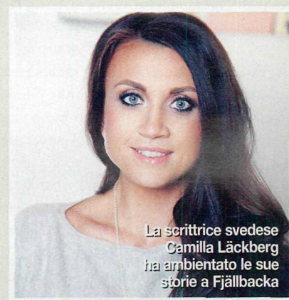
La scrittrice svedese Camilla Läckberg ha ambientato le sue storie a Fjällbacka

Fjällbacka si tinge anche dei colori del mare, le storie quelle dei pescatori che fino a fine novembre accolgono i viag-