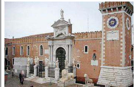
L'Arsenale di Venezia, uno dei simboli di Castello

La coda del pesce chiamato Venezia. Aldo Rossi prosegue nella sua fatica. Di ricerca e pubblicazione di guide originali. La Venezia «a piedi» consente di scoprire i grandi monumenti e le curiosità nascoste. «Una città che non è più la stessa della mia gioventù», ricorda Rossi. Oggi, per viverla nei suoi aspetti più autentici e originali, bisogna percorrerla fuori stagione, nelle serate di nebbia. Dopo Cannaregio e San Marco ecco allora Castello, a mettere un altro mattoncino nel progetto «Un sogno chiamato Venezia». Piccola guida anagrafica e fotografica del sestiere che occupa la parte est della città. «Qui troviamo un luogo che fatto la storia della città», scrive Rossi nella prefazione, «l'imponente fabbrica dell'Arsenale». Simbolo e storia della potenza navale della Se-