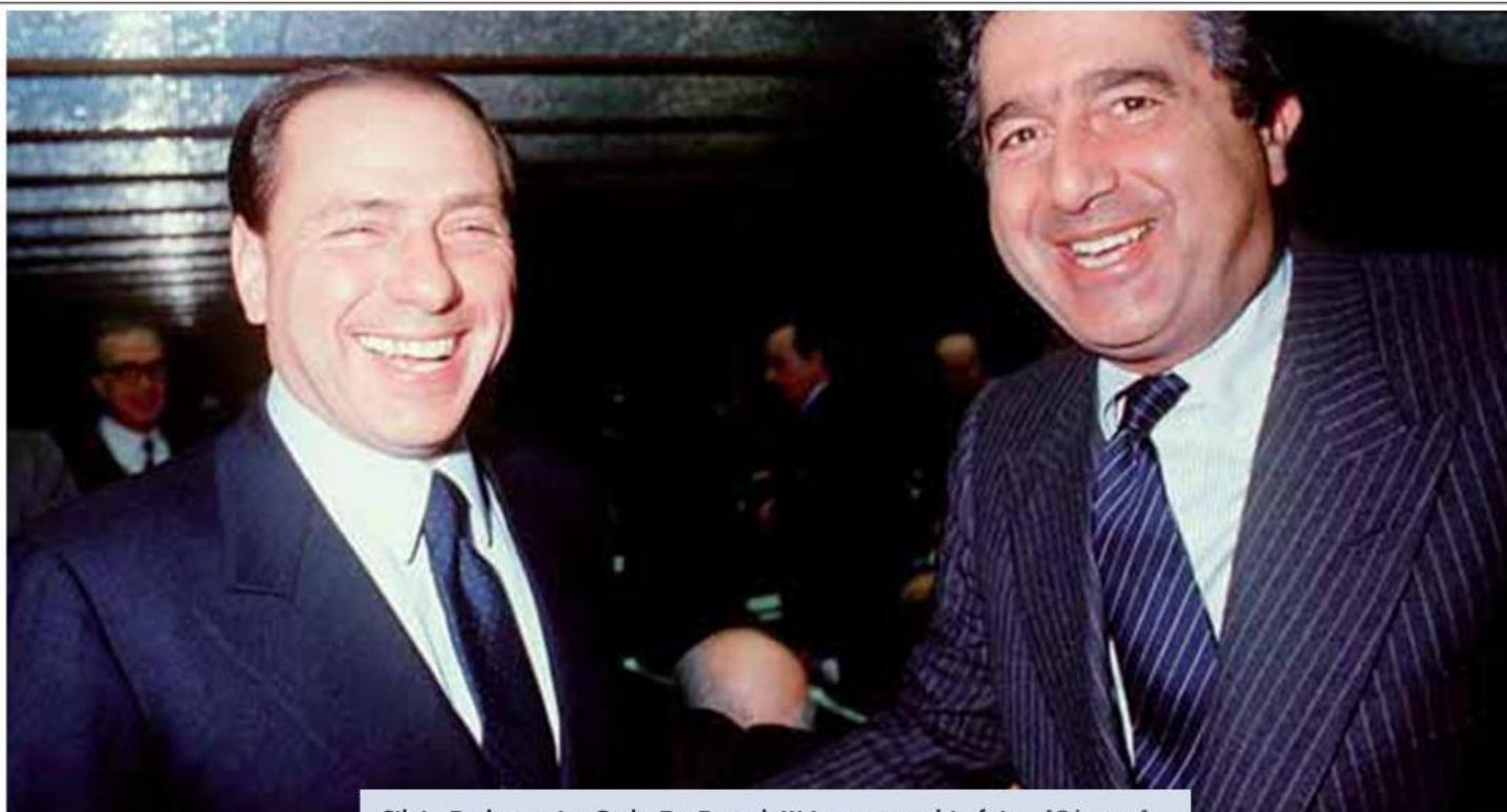
Silvio Berlusconi e Carlo De Benedetti in una vecchia foto