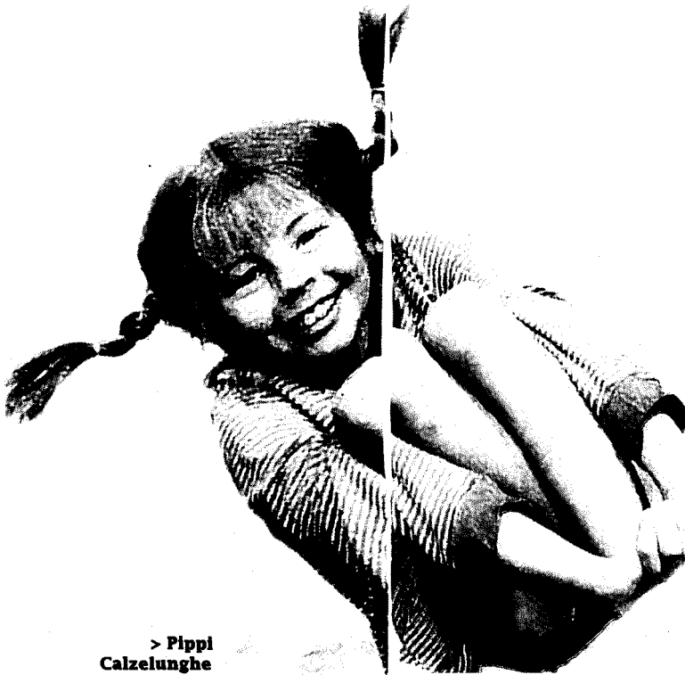
> Pippi Calzelunghe nella versione televisiva che le ha dato popolarità. Era interpretata da Inger Nilsson > a destra > Stieg Larsson

Astrid Lindgren è morta a Stoccolma il 28 gennaio 2002, all'età di 95 anni. Anni lunghi e ben spesi. Perché Lindgren è stata la scrittrice che ha fatto di più per l'infanzia, che ha fatto di più per le bambine. Ha confezionato per loro un personaggio unico, indimenticabile, Pippi Calzelunghe. Ha detto alle bambine: non abbiate paura, anche voi siete forti, libere, autonome. Lindgren inizia a scrivere quasi per caso. Nel 1941 la figlia viene costretta a letto da una polmonite. La mamma inizia a raccontarle storie. Un giorno la piccola le chiede: «Mi racconti la storia di Pippi Calzelunghe?». Nasce così il suo primo romanzo pubblicato nel 1945.