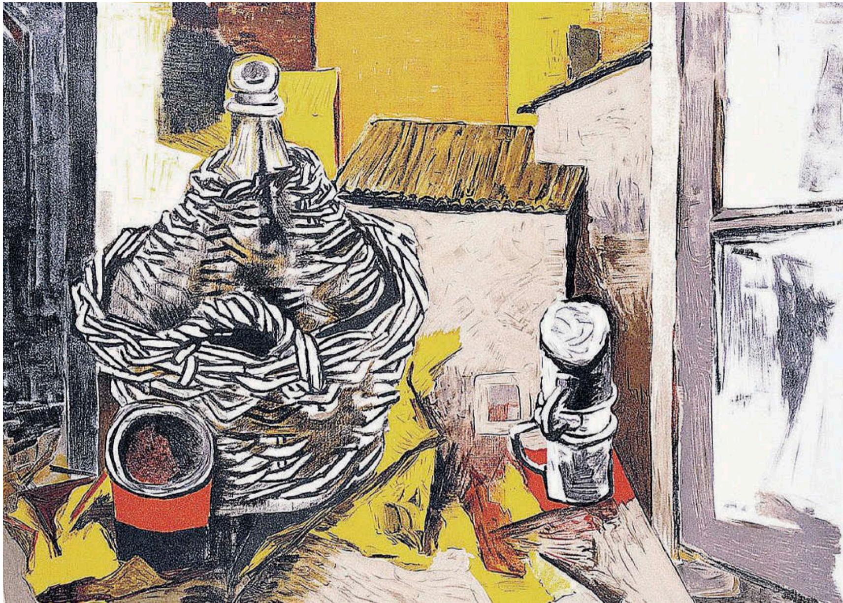
Renato Guttuso. "Damigiana e caffettiera"

«La letteratura di denuncia non esiste: esistono la buona e la cattiva letteratura» Domenico Cacopardo