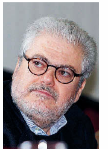
Il regista siciliano. Roberto Andò

Il regista siciliano Roberto Andò, il grecista Luciano Canfora, l'ex ministro Massimo Bray