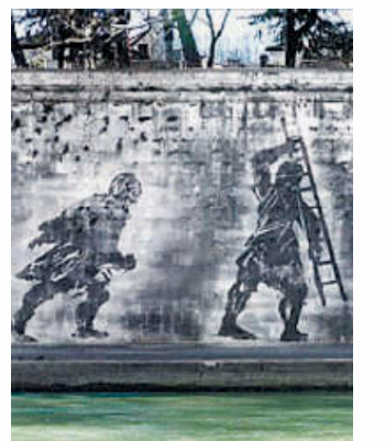
Una storia della Capitale. Alcune figure del murale

Il murale di Kentridge è stato inaugurato il 21 aprile scorso, in occasione delle celebrazioni del Natale di Roma. Si tratta di un'opera di 550 metri che percorre il muraglione del Tevere tra Ponte Sisto e Ponte Mazzini. Dal titolo «Triumphs and Laments» immortala la storia della Capitale attraverso 80 figure alte fino a 10 metri. Si celebra la fondazione della città, con Romolo e Remo, ma anche la sua tradizione cinematografica, con il celebre bacio tra Marcello Mastroianni e Anita Ekberg e letteraria, con un ricordo di Pasolini.