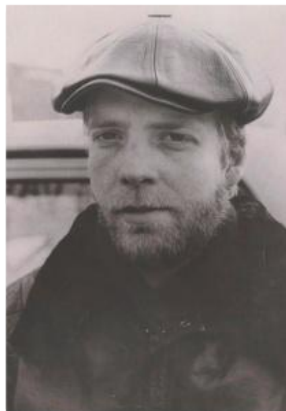
MATERIA Breece Dexter John Pancake (1952 - 1979)

Infine, nel racconto che dà il titolo al volume italiano, diventa emblematica la ricerca compiuta dal narratore di gasteropodi e trilobiti, organismi vissuti centinaia di milioni di anni fa, quando non c'era nulla di umano e la Storia era solo una lunga, indistinta preistoria: nessuna angoscia, nessun dolore, nessun pensiero. Pancake si convertì al cattolicesimo, ma a giudicare da come ha posto fine alla sua vita, e dalle cose che vedeva, non doveva esserne molto convinto.