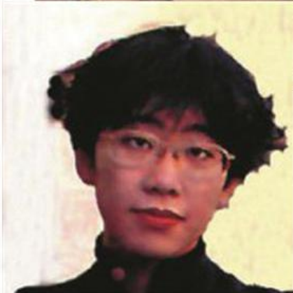
✓ Pronti, via Qui a fianco, Banana Yoshimoto; sopra, Chuck Palahniuk; poi Corrado Augias e Alessandro Baricco: sono fra gli autori più attesi della nuova stagione nelle librerie italiane