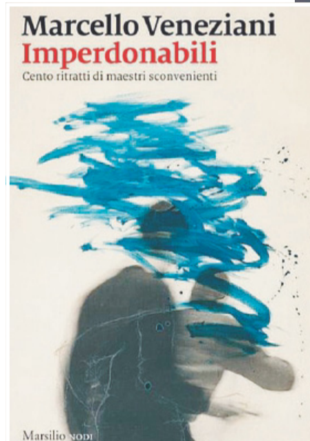
CULTURA Le copertine dei due libri scritti da Marcello Veneziani (in alto)

Partiamo da «Imperdonabili», volume nel quale Veneziani si richiama chiaramente all'esperienza di Cristiana Campo, poetessa cattolica conservatrice - o mistica, così come è stata definita da Massimo Cacciari - e fine scrittrice che amava indugiare nella ricerca interiore dell'animo umano. Gli imperdonabili, pertanto, sono gli irregolari del pensiero che rifuggono dal conformismo dettato da un determinato periodo storico verso il quale, anzi, provano evidenti sentimenti di ribellione, preferendo volgere lo sguardo indietro, ossia verso una tradizione depurata da emergenze contingenti. Tra questi «imperdonabili», che vanno