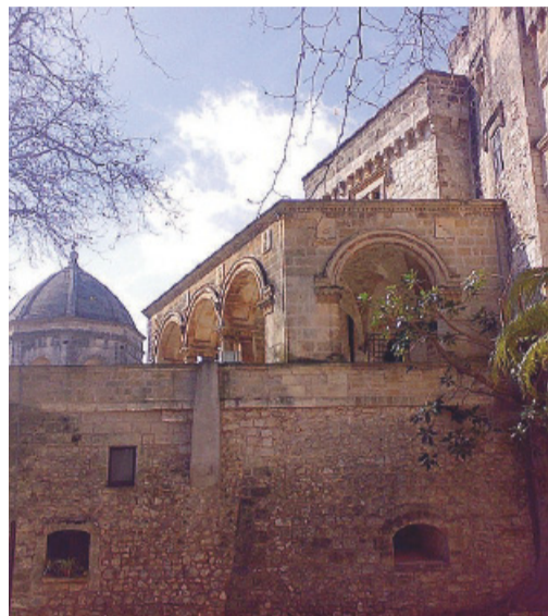
CAROVIGNO Il Castello dei Dentici di Frasso