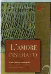
L'AMORE INSIDIATO di Carlo Caffarra, Cantagalli, pp. 180, € 15,00