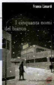
I CINQUANTA NOMI DEL BIANCO di Franco Limardi, Marsilio, pp. 392, € 17,50