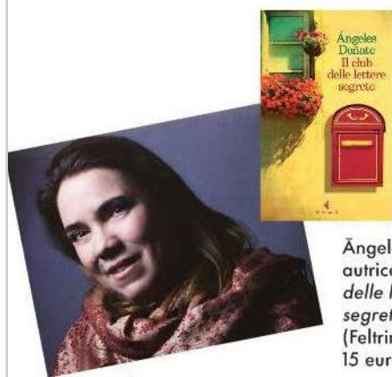
Ángeles Doñate, autrice di Il club delle lettere segrete (Feltrinelli, 15 euro).

Una ragazza che guarda alla vita con gli occhi meravigliati di una bambina. Un pinguino che non vuole separarsi dall'uomo che lo ha salvato. Un pozzo magico che cattura una famiglia intera, in un'Inghilterra apocalittica. Storie incredibili, che sanno essere avvincenti