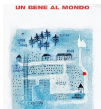
«Un bene al mondo»