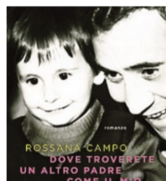
«Dove troverete un altro padre...»

diffuse, andrà semmai indicato «nel comune indugiare intorno a un'assenza che sempre fonda l'identità dei personaggi, o, direttamente, quella di chi scrive. Una mancanza, un vuoto al centro che si fa baricentro strutturale ed emotivo delle storie raccontate, nonché delle scritture che le sostanziano».