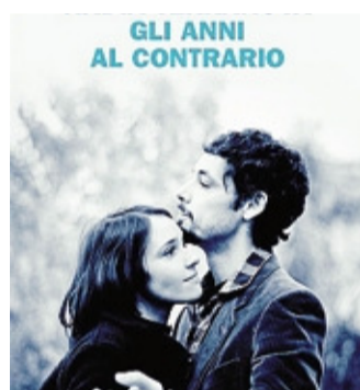
«Gli anni al contrario»

protagonista è il suo dolore, cane-personaggio dotato di autonoma consistenza.