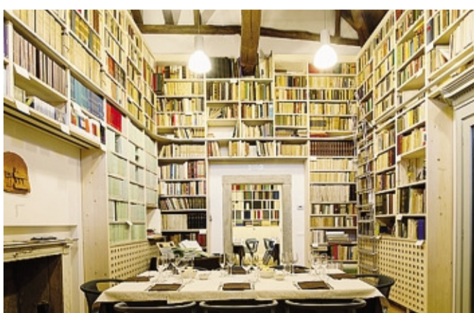
La Bibliostera a Cà Berizzi di Corna Imagna