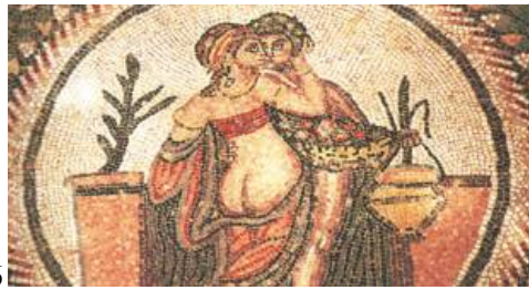
OVIDIO ARS AMATORIA 1