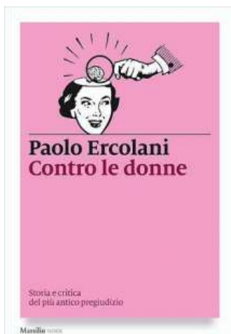
COVER CONTRO LE DONNE