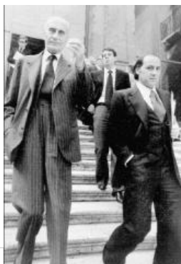
SILVIO BERLUSCONI E INDRO MONTANELLI