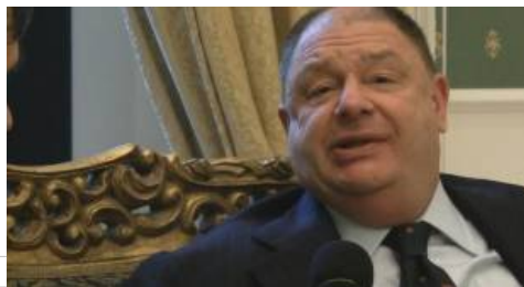
paolo isotta isotta fondazione 620x330

Paolo Isotta, un po' piemontese e molto napoletano, devoto di San Gennaro, del quale afferma di godere ampia protezione, è il critico musicale (precisiamo, storico della musica) più bravo e più importante d'Italia. Lo sanno tutti, ma non tutti sono disposti ad ammetterlo, per motivi imperscrutabili.