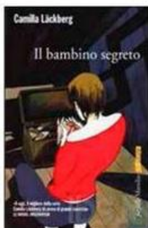
IL BAMBINO SEGRETO Camilla Läckberg Editore Marsilio pagine 526 euro 19,00

L'ESTATE sta per finire e Fjällbacka, cittadina sulla costa occidentale della Svezia, si svuota della folla di turisti. Per Erica è il momento di affrontare una scoperta inquietante: nella soffitta di casa, dove la madre Elsy conservava i suoi oggetti più cari, ha trovato un diario e una medaglia dell'epoca nazista avvolta in una camicina da neonato macchiata di sangue. Decide di chiedere aiuto a uno storico esperto della seconda guerra mondiale ma, dopo il primo incontro, il vecchio professore viene assassinato. Mentre Patrik cerca maldestramente di conciliare il suo congedo di paternità con il desiderio di partecipare alle indagini, Erica si immerge nelle pagine del diario e nel drammatico passato di cui raccontano. Chi è disposto a tutto pur di impedirle di risalire alla verità?