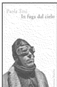
Paola Tosi In fuga dal cielo Marsilio pp. 109 € 13,00