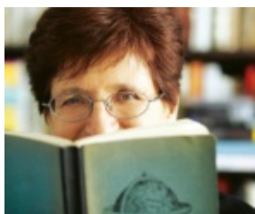
di Nicoletta Sipos