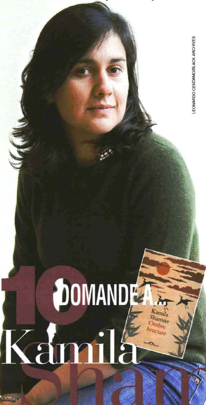
LEONARDO CENDAMORBLACK ARCHIVES

Che l'ispirazione vale poco. Bisogna forzarsi di scrivere con disciplina giorno dopo giorno per combinare qualcosa.