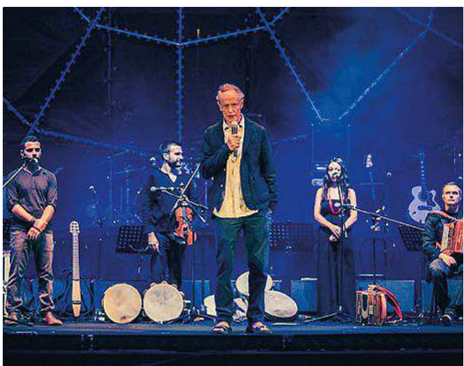
Erri De Luca con il Canzoniere Grecanico Salentino