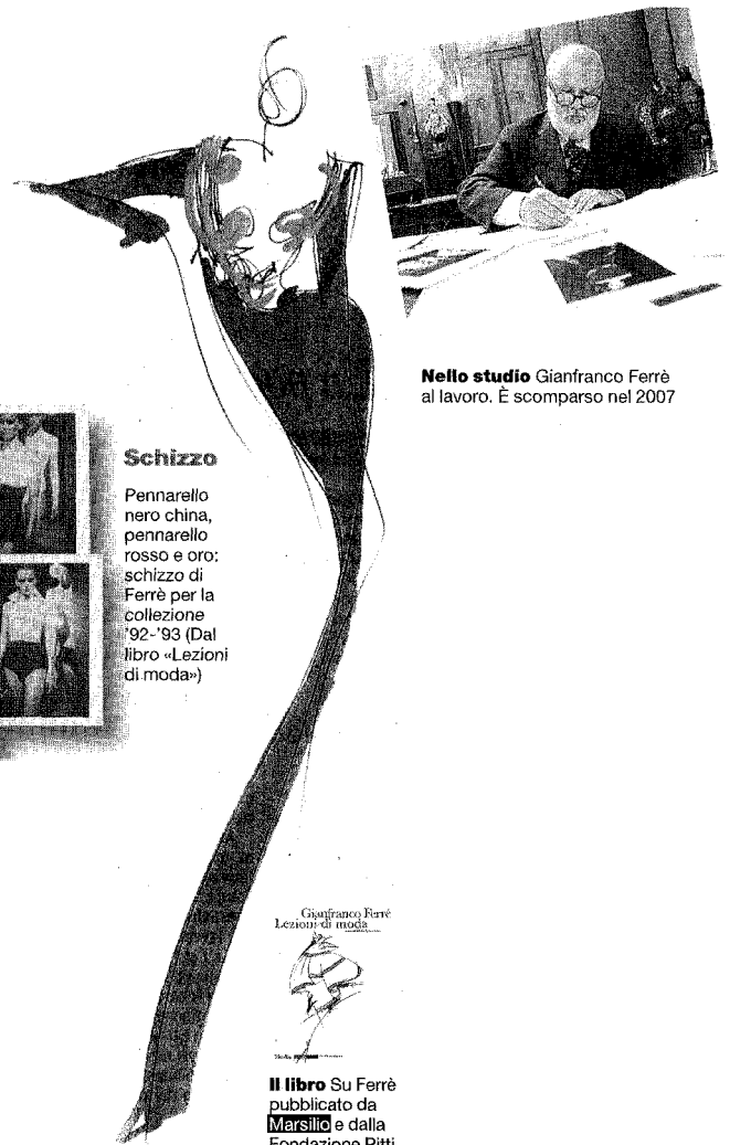
Nello studio Gianfranco Ferrè al lavoro. E scomparso nel 2007

Pennarello nero china, pennarello rosso e oro: schizzo di Ferrè per la collezione '92-'93 (Dal libro «Lezioni di moda»)