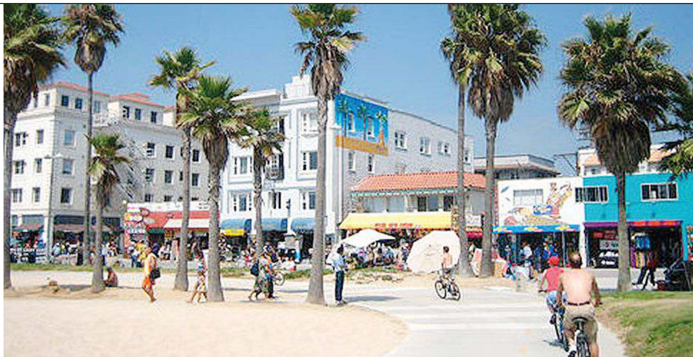
Venice Beach in California. Sotto, un'immagine di Naples in Florida e di Rome in Georgia: sono le città "italiane" in America

Dalla parte opposta dell'oceano Verona, New Jersey, dove fino al 2013 operava la Annin, la più grande e antica azienda produttrice di bandiere degli Stati Uniti: partendo da qui milioni di stelle e strisce sono state consegnate alla storia, fissando momenti memorabili. Nello stabilimento di Verona è stata confezionata la bandiera lasciata sulla luna dopo il primo sbarco, così come quella issata dai militari americani a Iwo Jima dopo la vittoria sui giapponesi e, non fosse sufficiente la suggestione, quella che l'11 settembre si trovava nei pressi della torre sud del World Trade Center. Travolta dai detriti, aveva resistito stoicamente diventando un simbolo