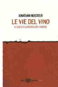
Jonathan Nossiter Le vie del vino Il gusto e la ricerca del piacere Einaudi

«Ogni vino possiede tratti e carattere ben definiti, che lo rendono unico e distinguibile nel panorama enoico, così come è facile riconoscere nelle singole persone molte delle particolarità del segno a cui appartengono. Con un sillogismo innegabile: ci sono vini che si abbinano perfettamente a certi segni, ma non hanno niente in comune con altri. Da questa base di partenza è nata l'idea di scrivere a quattro mani un libro che giocasse sullo spunto astrologico per addentrarsi nel mondo dei vini»